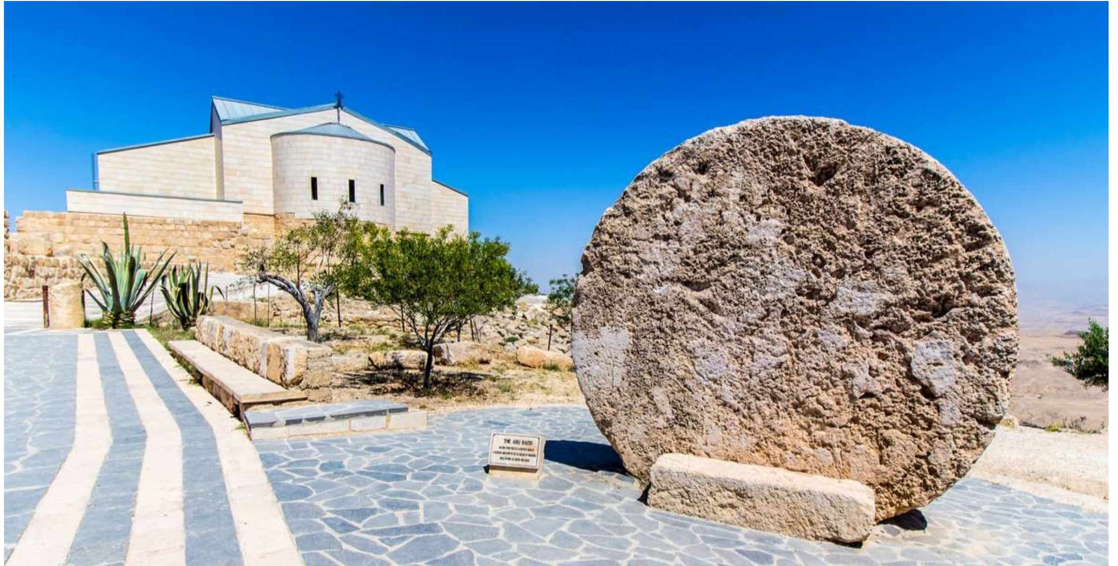
THE AJU BADO A LARGE, CIRCULAR, TEXTURED STONE ARTIFACT, LIKELY A MOUND OF CLAY OR A BURNED CLAY ARTIFACT, IS DISPLAYED IN FRONT OF THE MUSEUM.